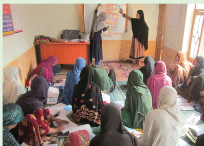
村の女性たちの識字教室

アフガニстанの識字率は、男性 38.2%、女性 24%で 160 か国中 155 位(2015 年)で最も低い国のひとつです。